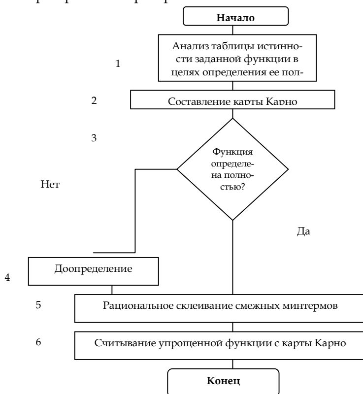
Рис. 2. Алгоритм метода минимизации Карно

множества X двоичных входных переменных в множество Y двоичных выходных переменных: Y = \lambda X . В ходе абстрактного синтеза имеет место переход от содержательного описания к формализованному заданию оператора в виде таблицы истинности, матрицы или графа. В процессе структурного синтеза определяется структурная схема устройства. Научный аппарат алгебры логики позволяет осуществить переход к заданию оператора в виде формулы, упростить ее и так подобрать элементную базу, чтобы структурная схема получилась наиболее простой, т.е. содержала минимально возможное число компонентов. В рабочей тетради приведены задания для аудиторных занятий и самостоятельной работе по алгебре множеств, алгебре логики, теории цифровых автоматов. Студенты используют эвристики в виде алгоритмов для целей минимизации в процессе синтеза цифрового устройства (рис. 2).